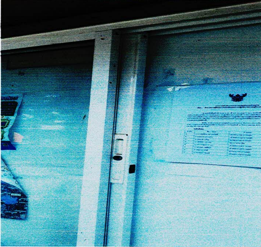
ภาพถ่ายหลักฐานประกาศรายงานผลการประเมินผลการปฏิบัติราชการประจำปีของบุคลากรในหน่วยงานฯ